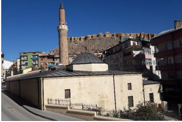
Ulu Camii'nin Batı ve Güney Cepheleri (Restitüsyondan önce ve sonra)